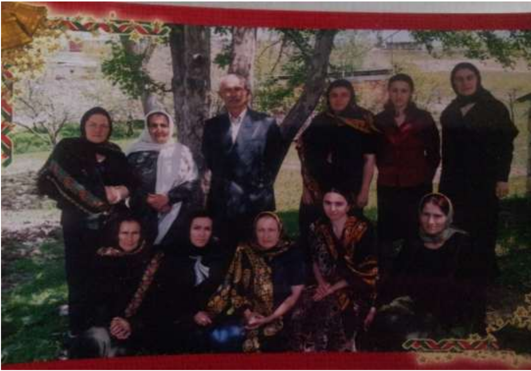
Школала учителътала коллектив.