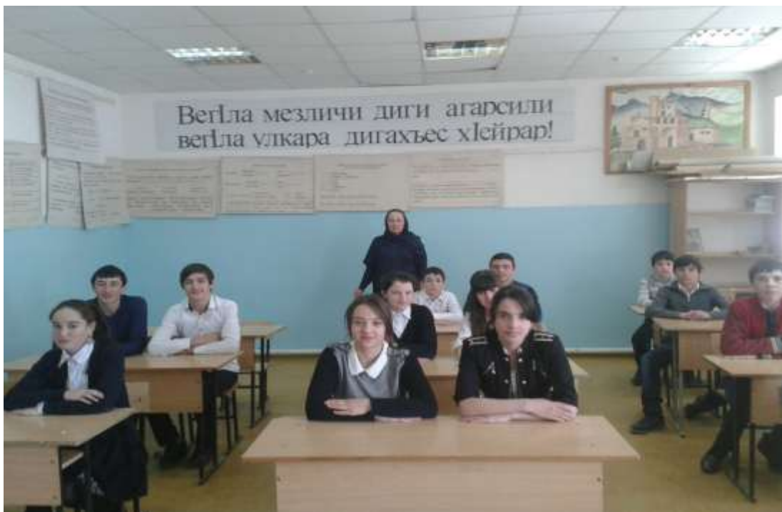
Дарган мезла кабинетлизиб дила дарс.